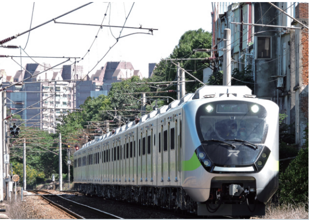
動力/控制線束解決方案 台鐵 EMU900/EMU3000 新城際列車

Cembre 軌道鑽孔機、鋸軌機、螺栓鬆緊機均協助辛苦的維護人員，以符合人體工學的施工設備完成保養改善、搶修任務。