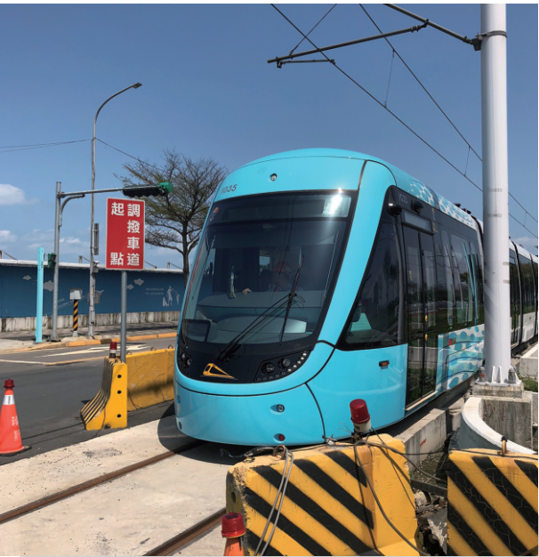
PMA 電纜保護管系統解決方案 新北輕軌車輛

以實際作為支持國車國造計劃，凌特國際協助設計列車動力系統與車內配線的電纜保護管系統，以符合世界最先進的防火標準，增進人員與車輛安全。