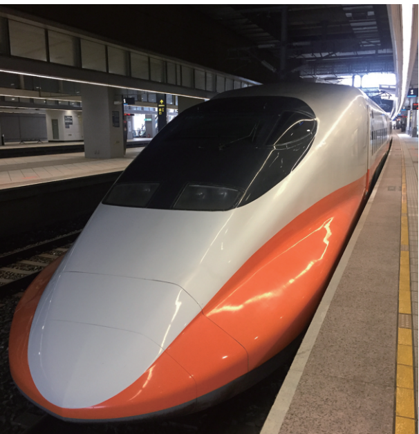
PMA 電纜保護管系統/CCTV 連接器方案 台灣高鐵 700T 車輛

凌特國際提供專業的電纜與其軌道車輛標準諮詢服務，並在線束工程設計上協助新一代列車達成高可靠度與安全性能。